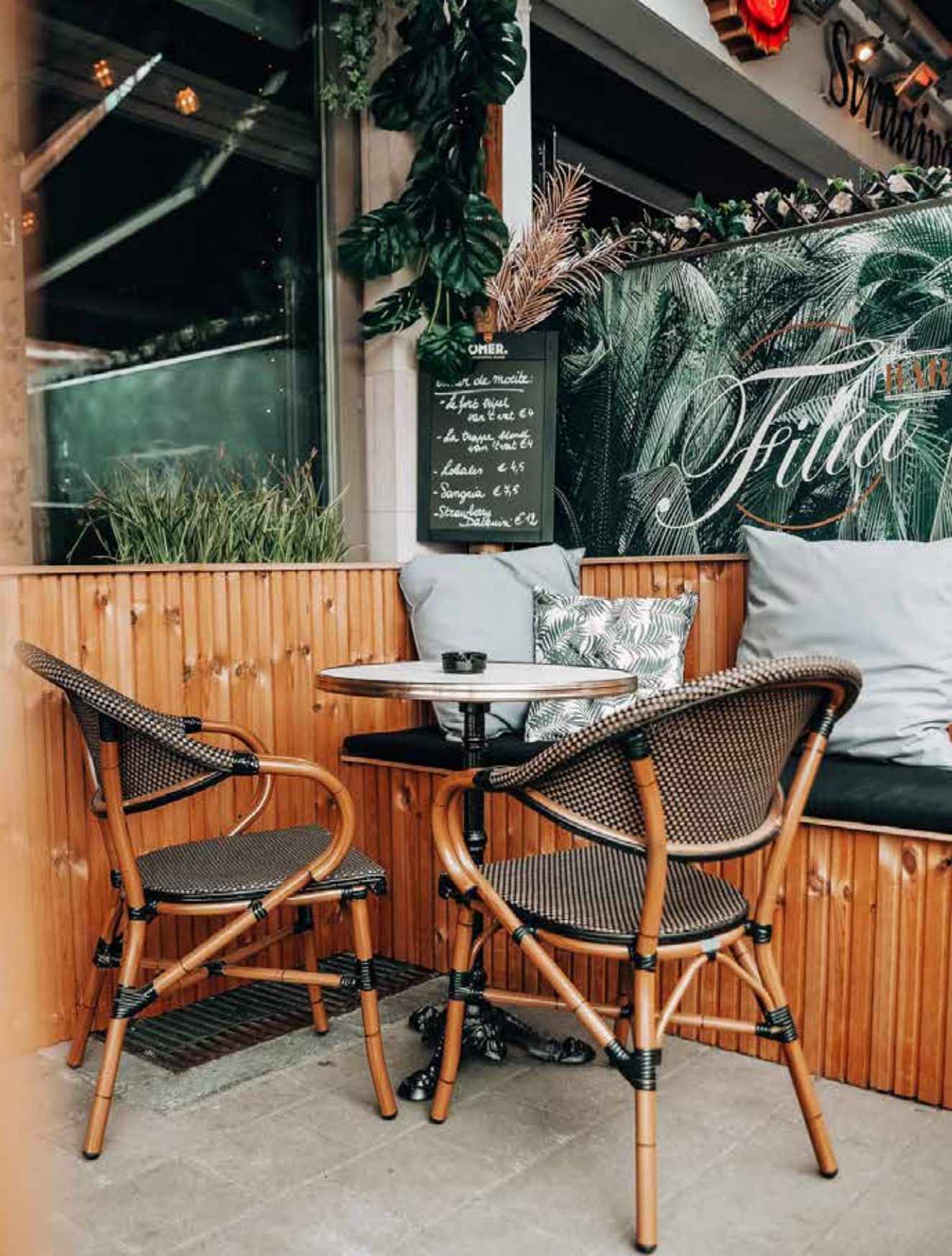
▲ Bar Filia - Kortrijk