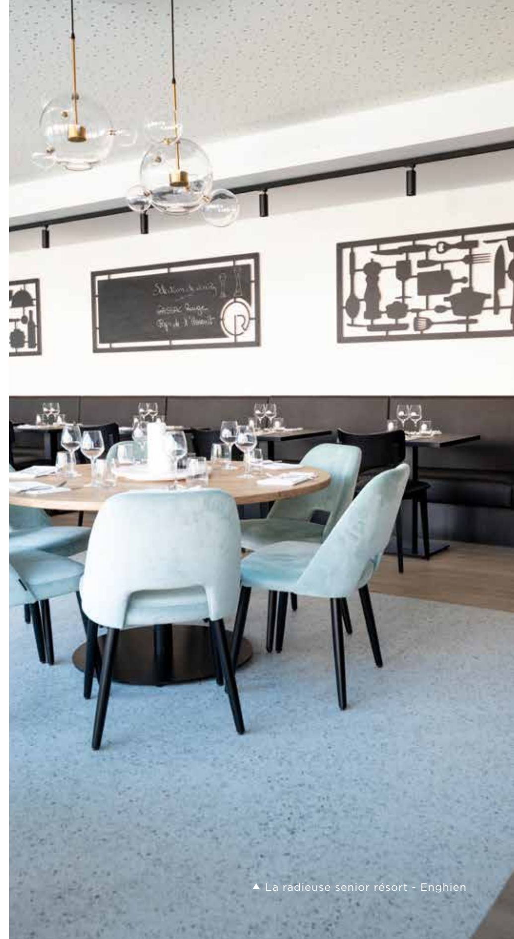
▲ La radieuse senior resort - Engien