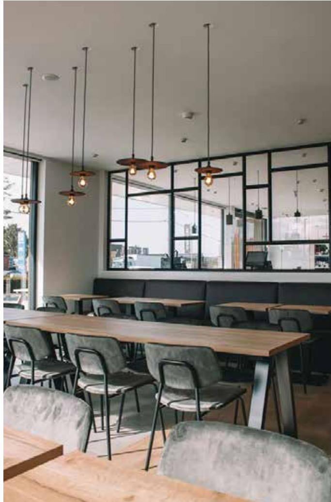
▲ Q Linair - Ardoois