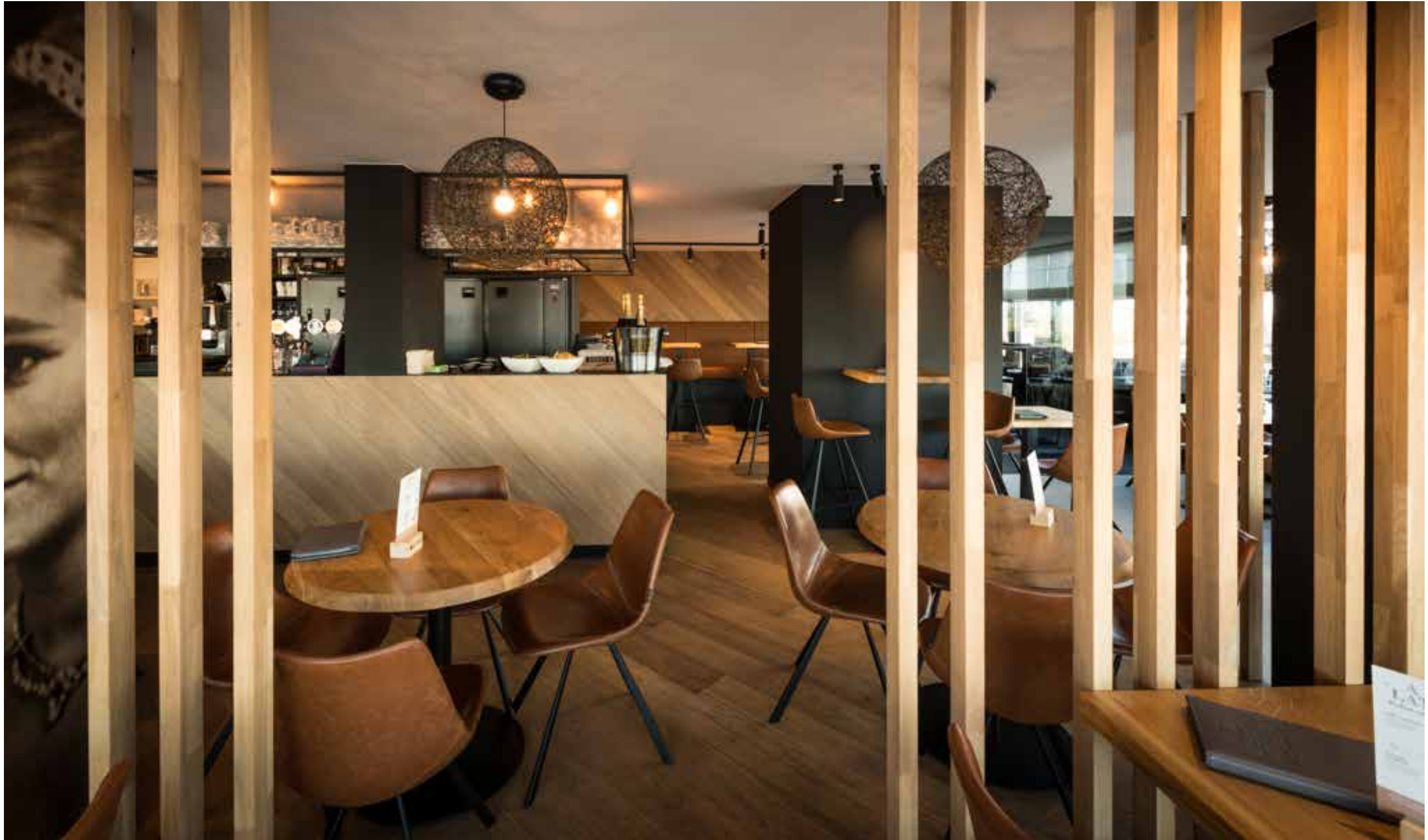
▲ Paola - Heist