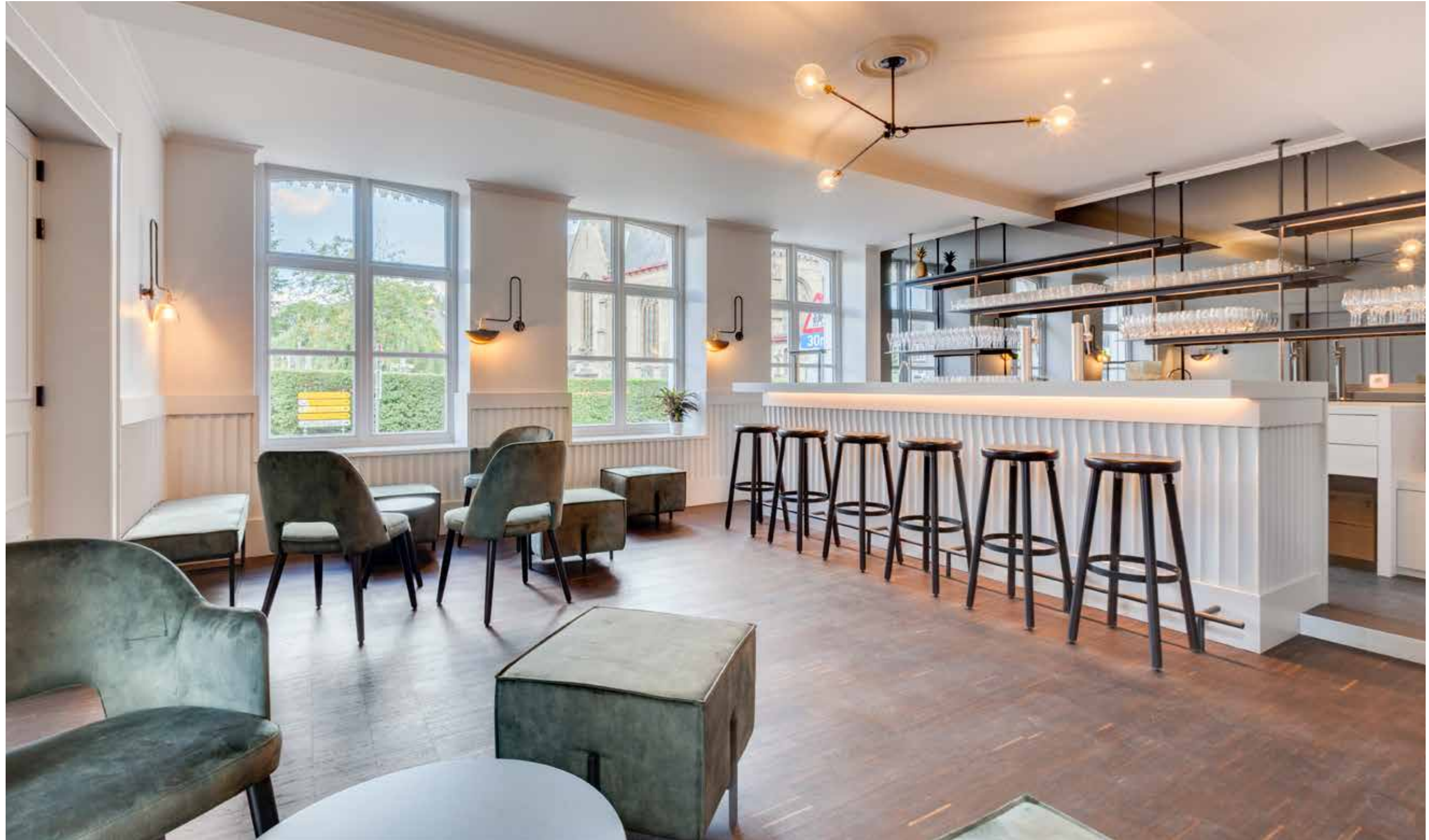
▲ Douvieuhuis - Watou