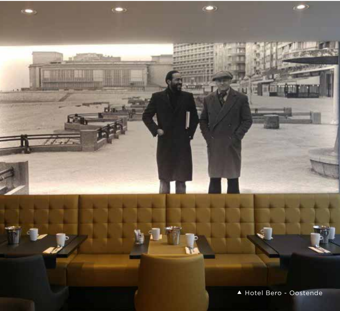
▲ Hotel Bero - Oostende