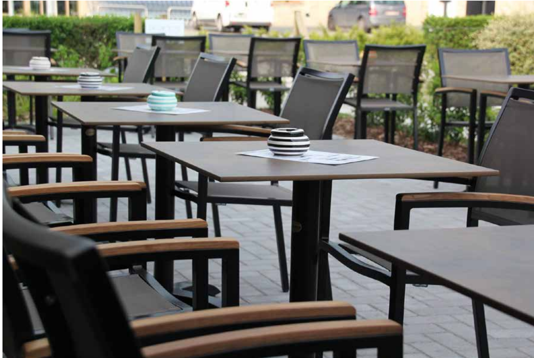
▲ Dag en Douw - Koekelare