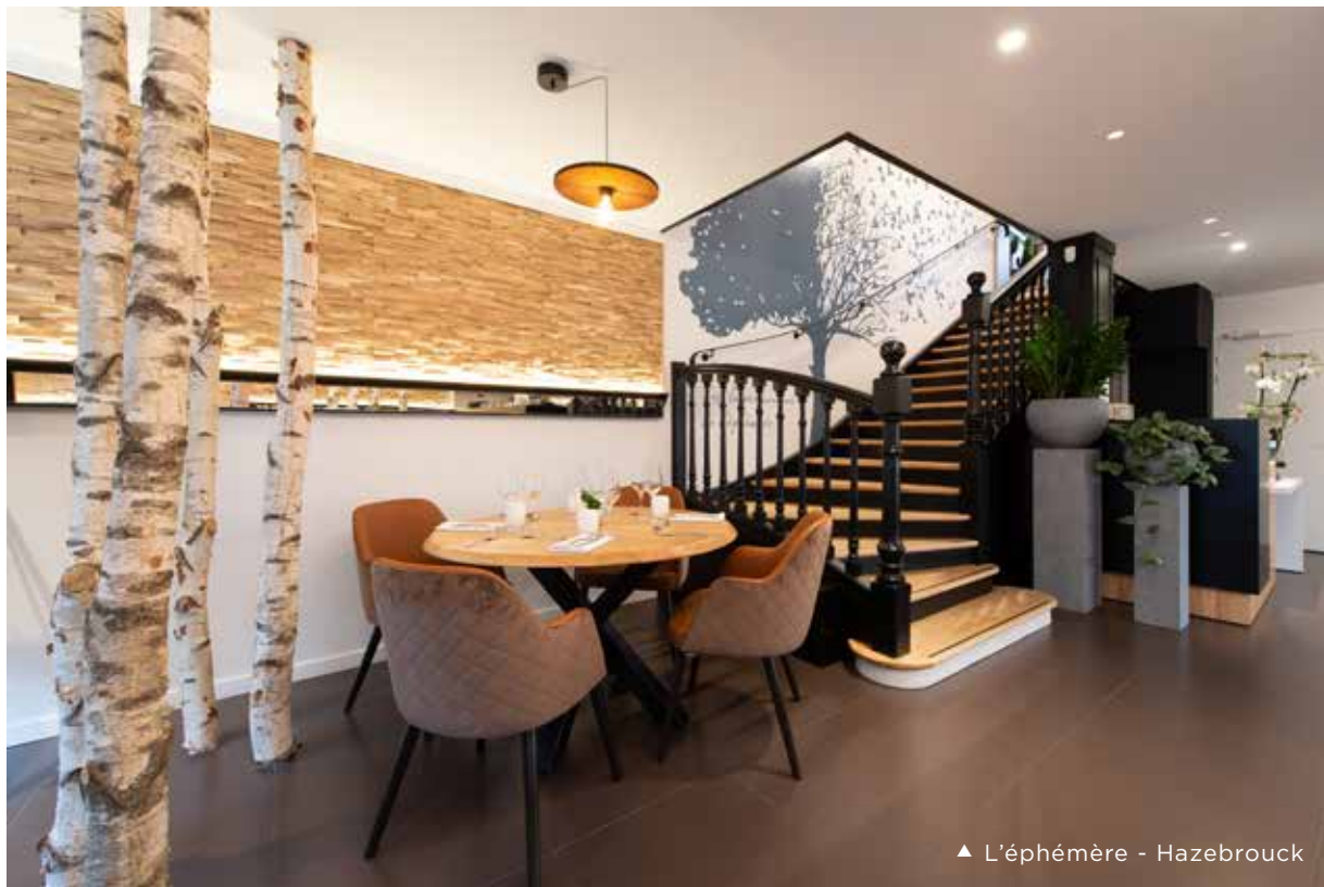
▲ L'éphémère - Hazebrouck