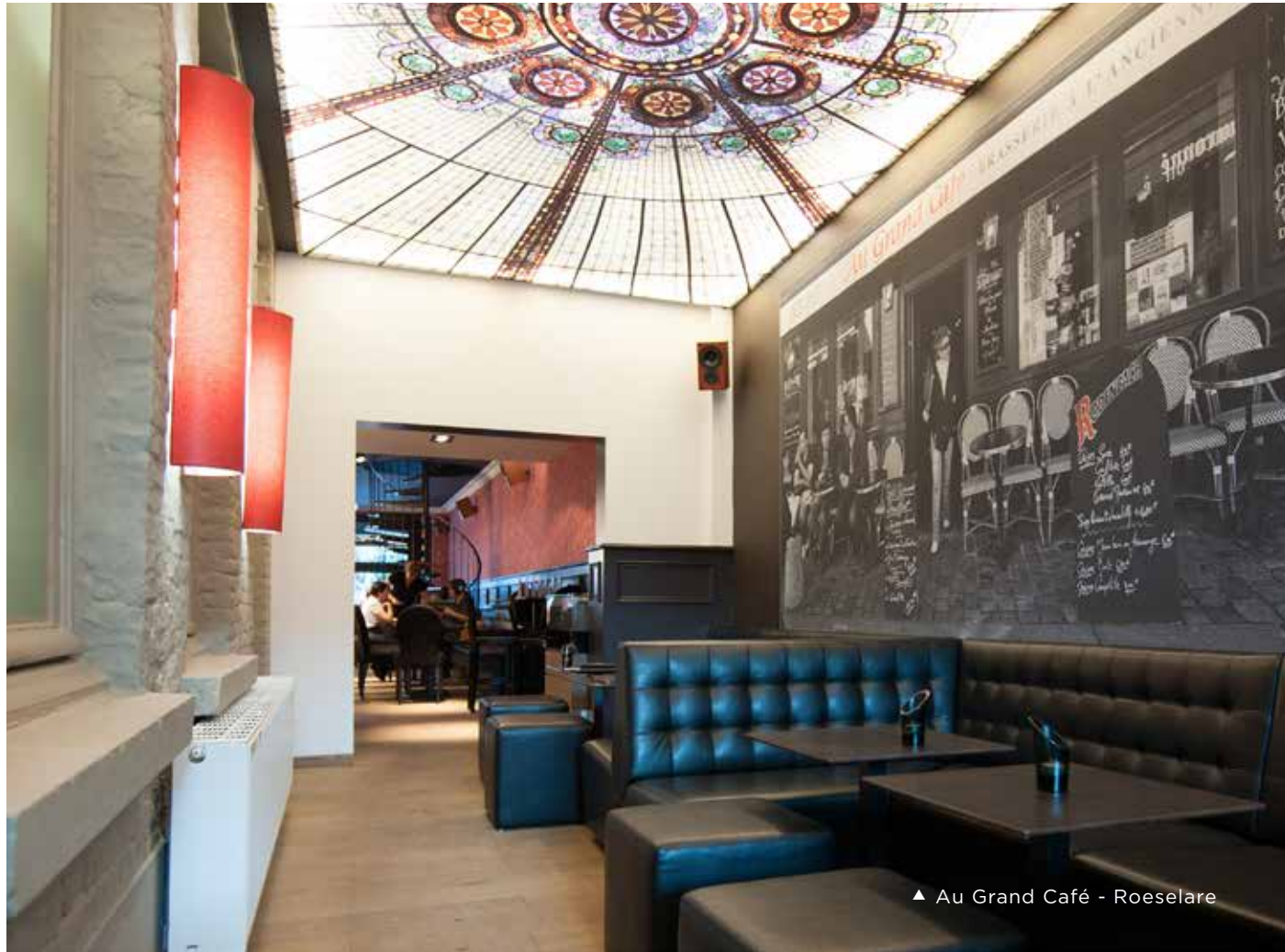
▲ Au Grand Café - Roeselare