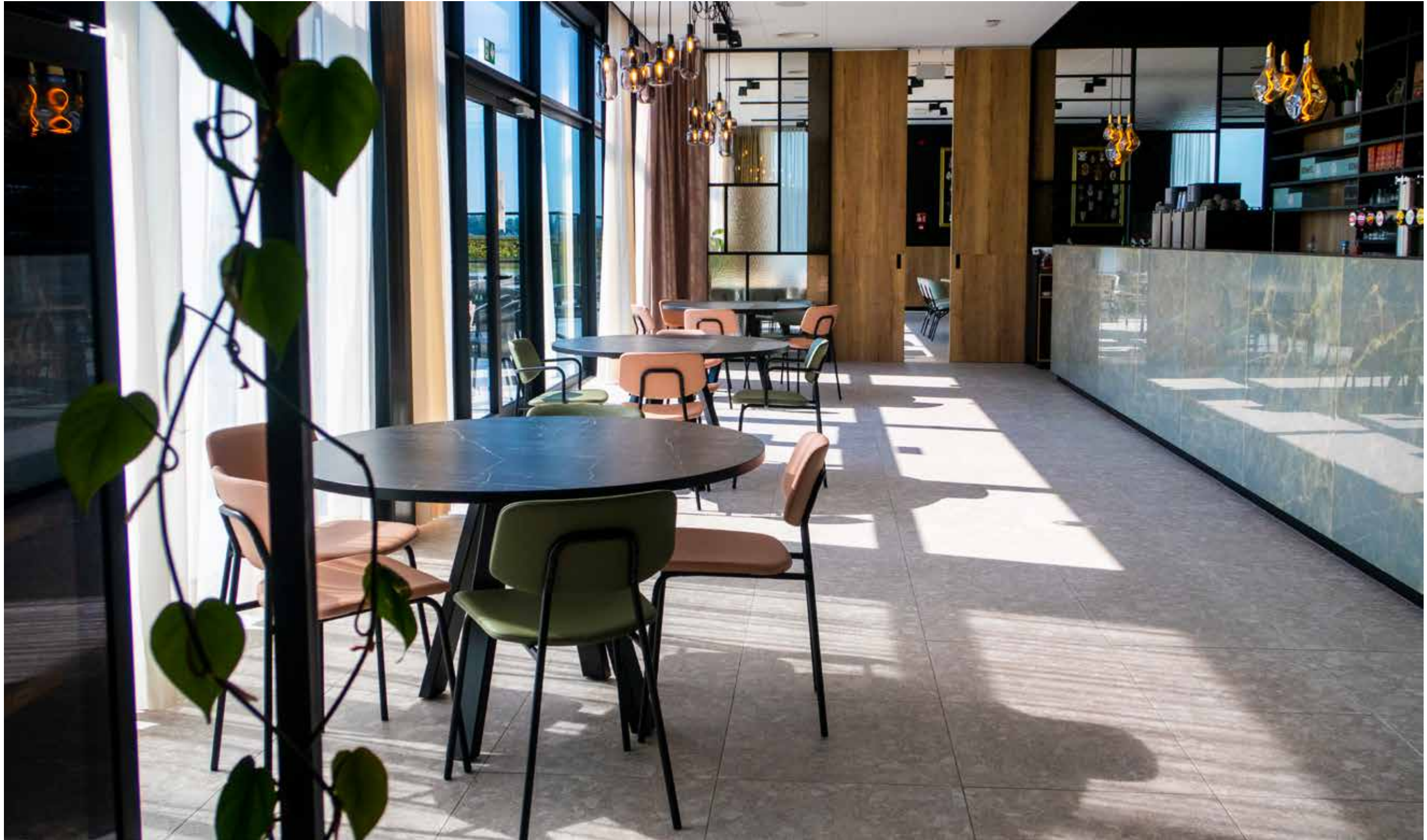
▲ De Zes Bochten - Knokke