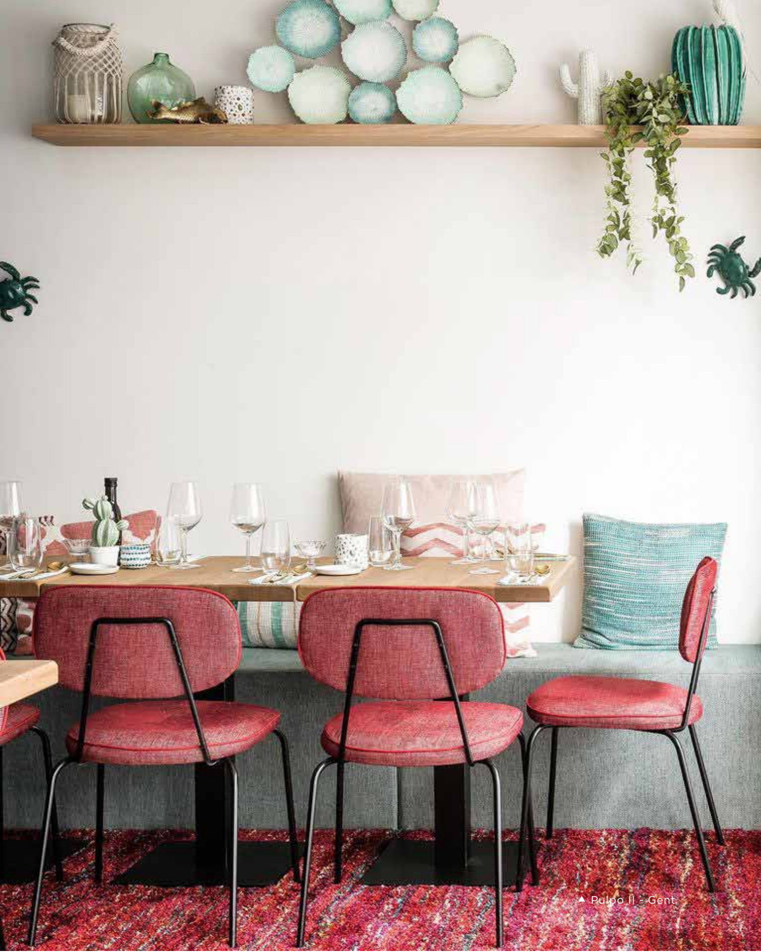
▲ Pulpo II - Gent

some people look for a beautiful place, others make a place beautiful