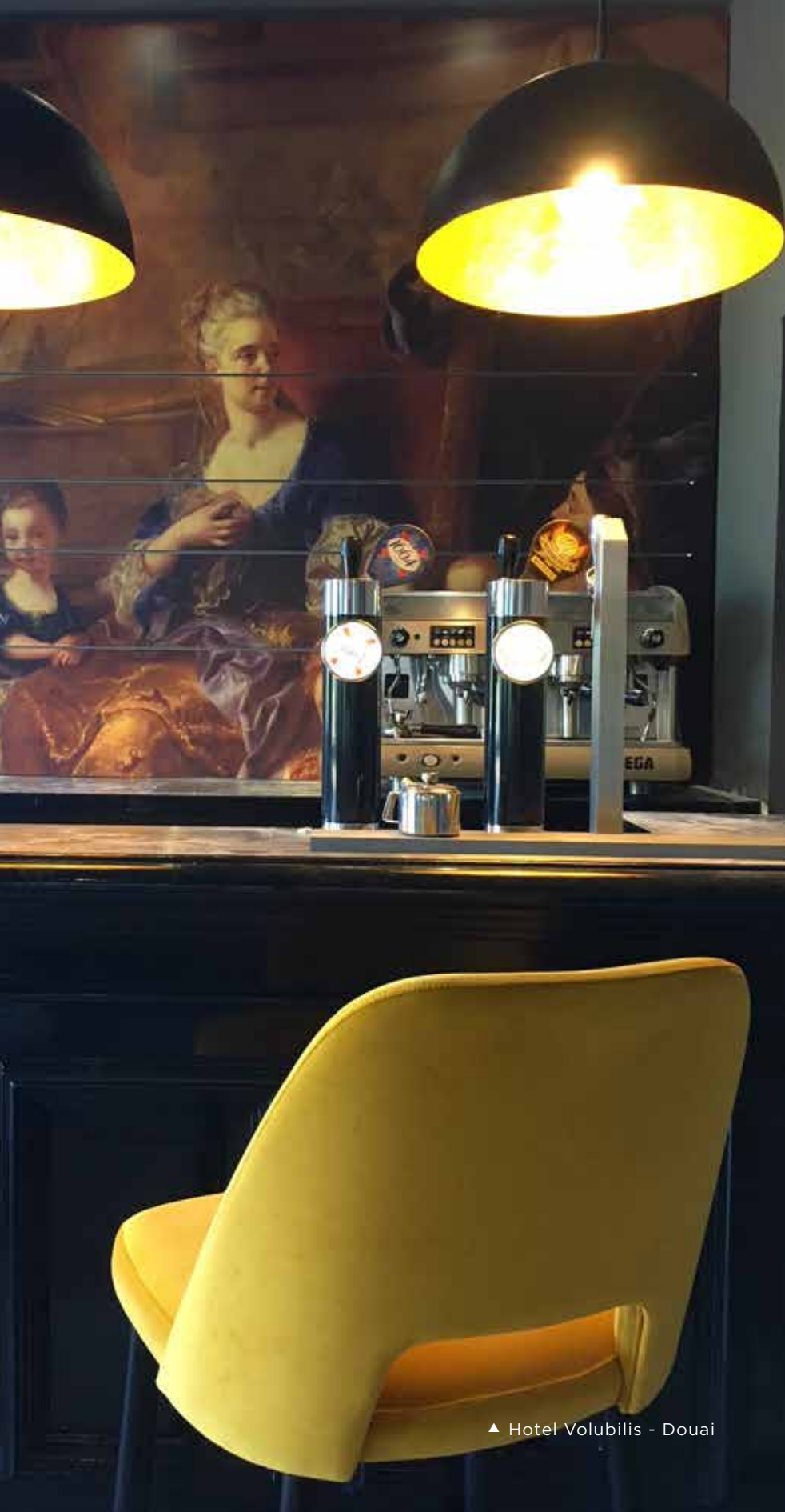
▲ Hotel Volubilis - Douai