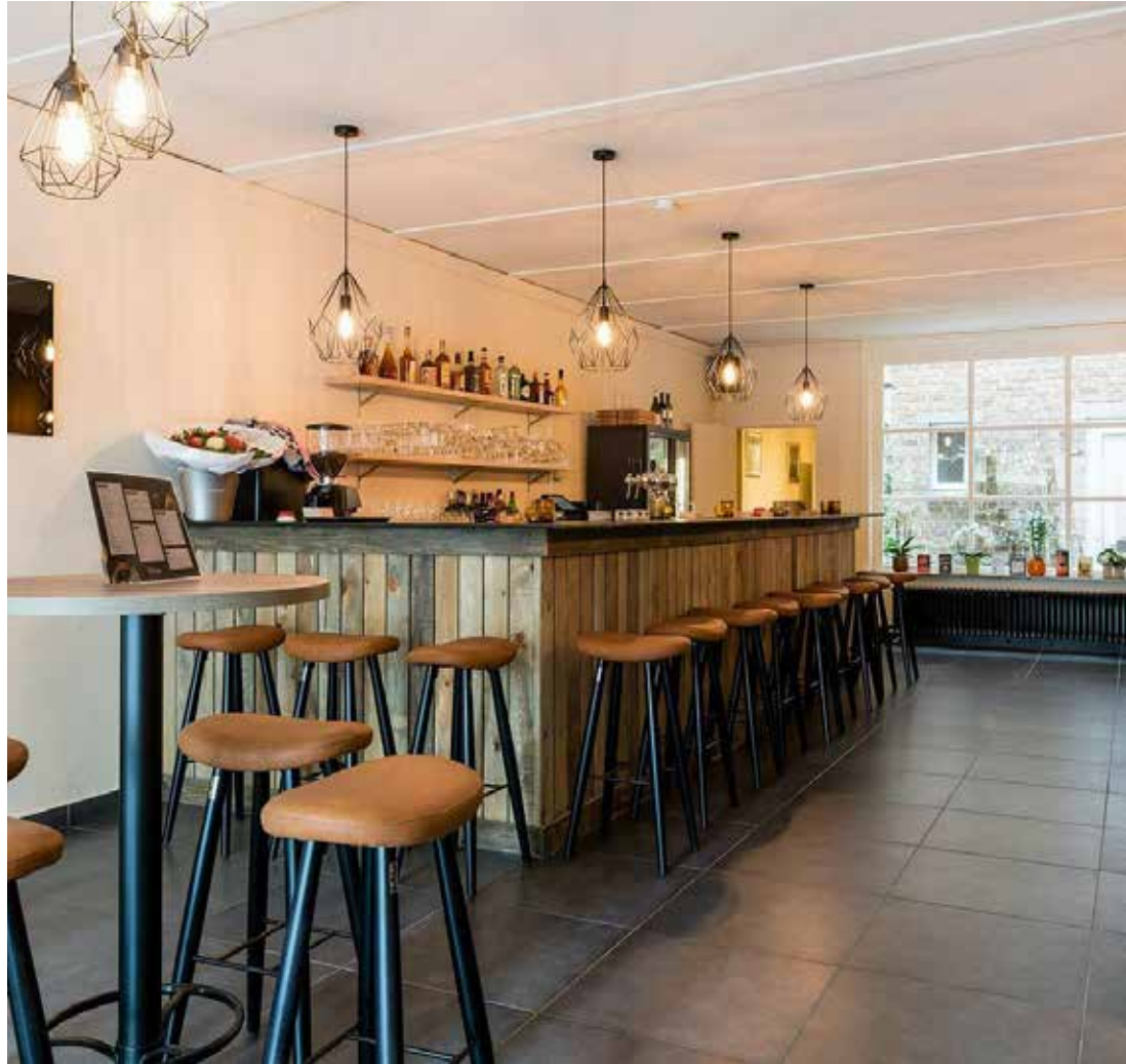
▲ Divine - Kortrijk