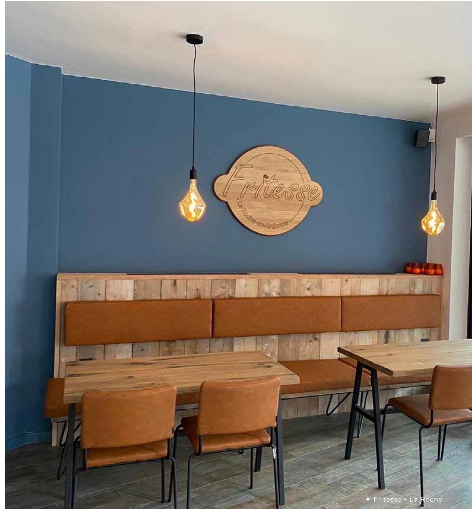
▲ Fritesse - La Roche