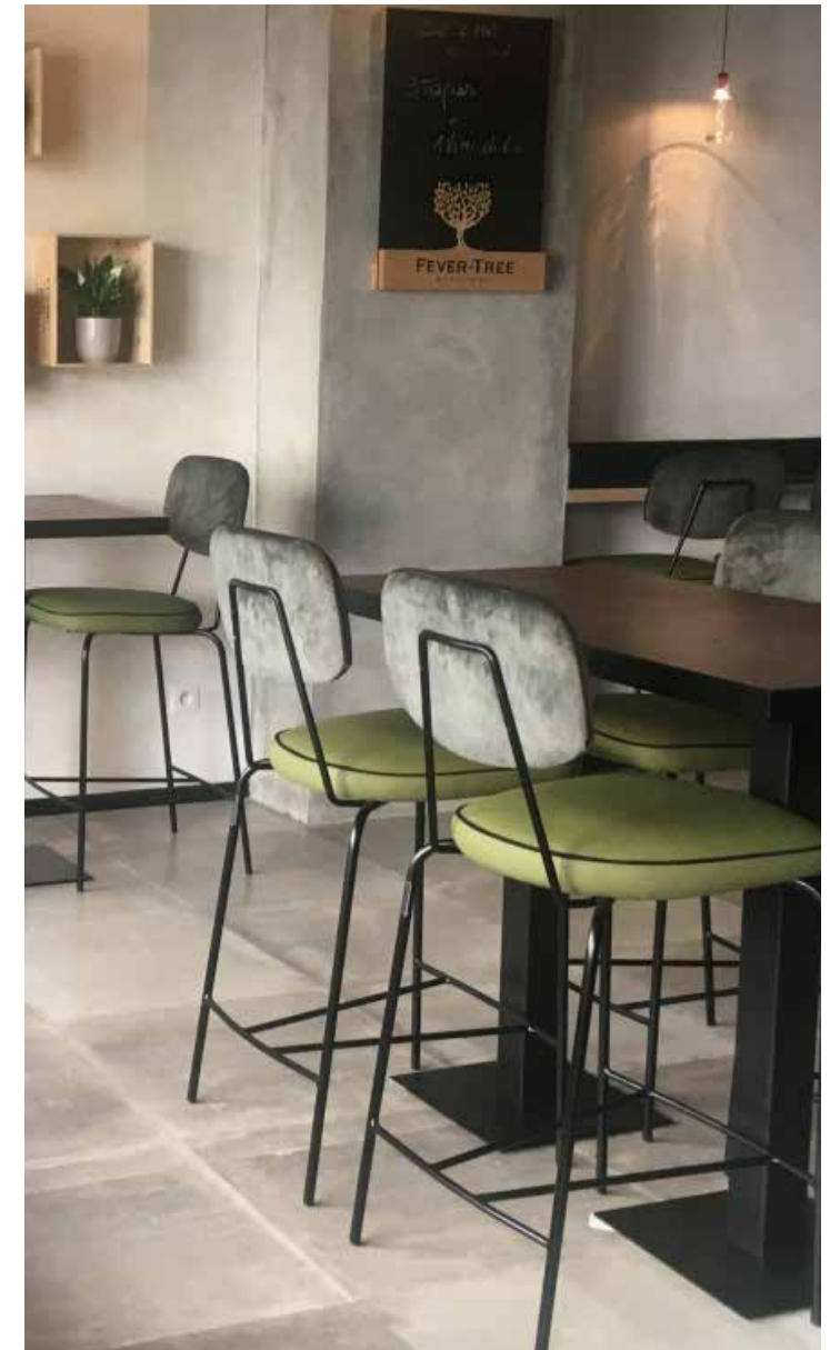
▲ Vis à Vis - Mons