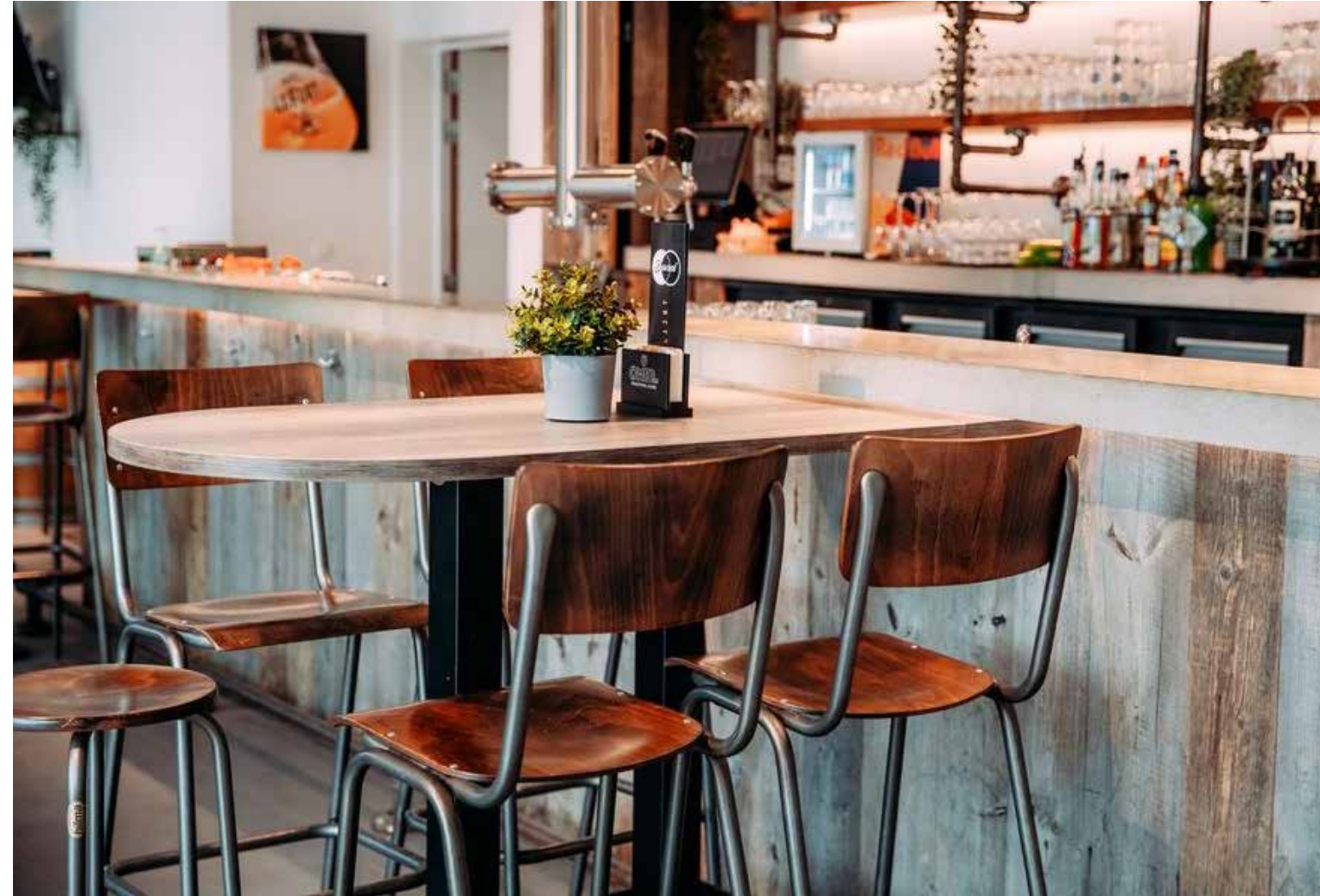
▲ Barsol - Kortrijk