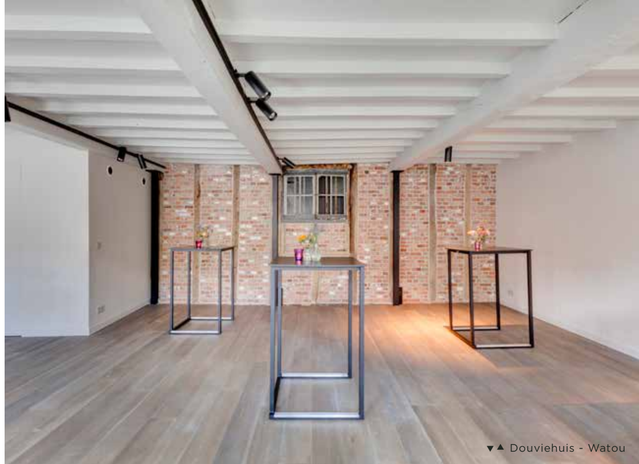
▼▲ Douvieshuis - Watou