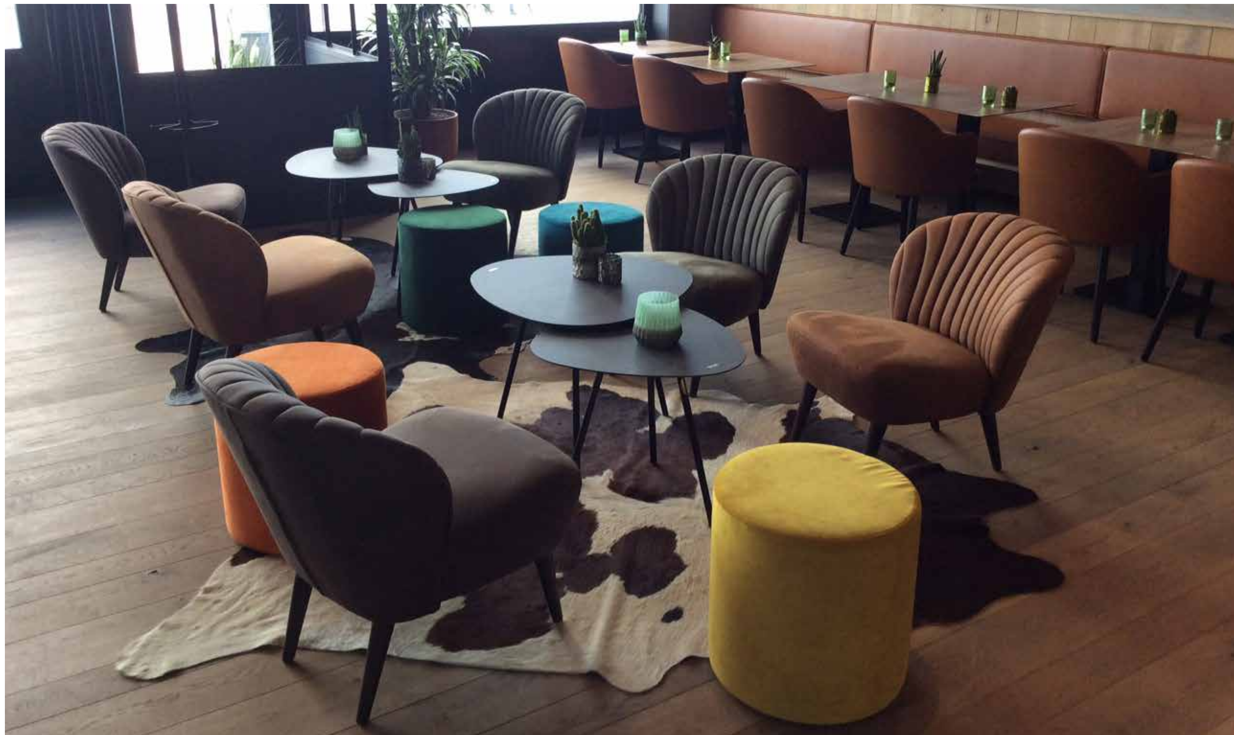
▲ Elyzee - Oostende