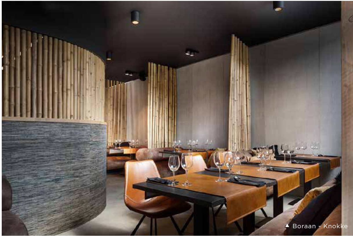
▲ Boraan - Knokke