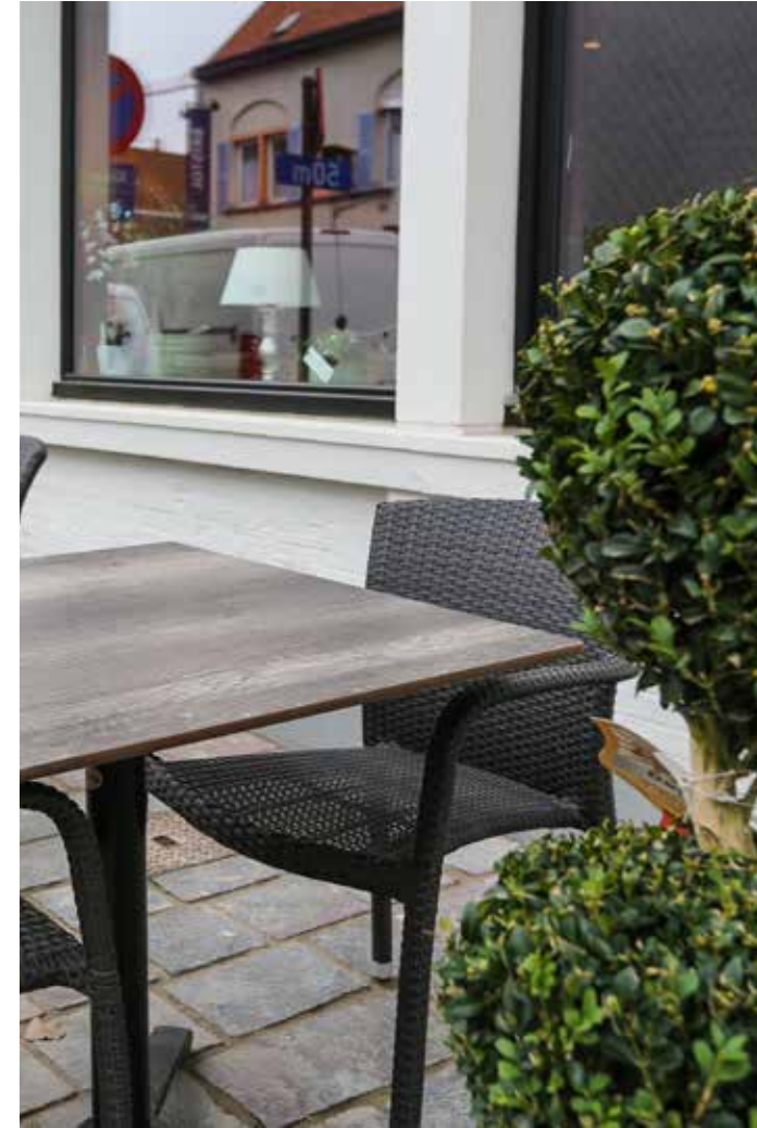
▲ De Haven - Nieuwpoort