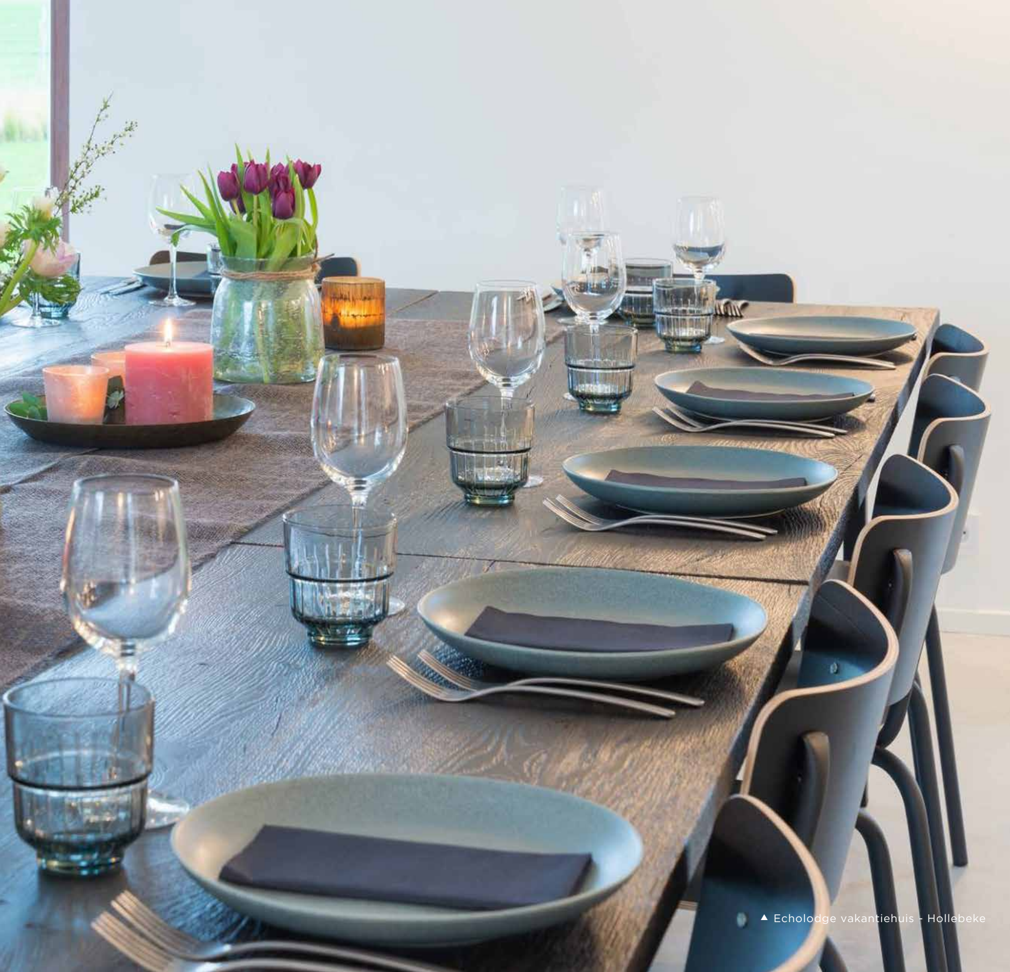
▲ Echolodge vakantiehuis - Hollebeke