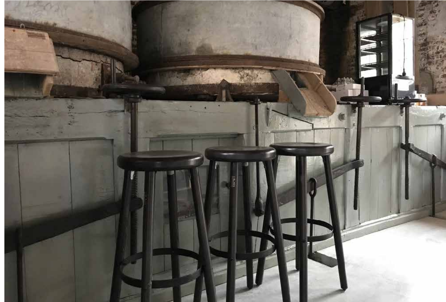
▲ Atelier Hortense - Reningelst