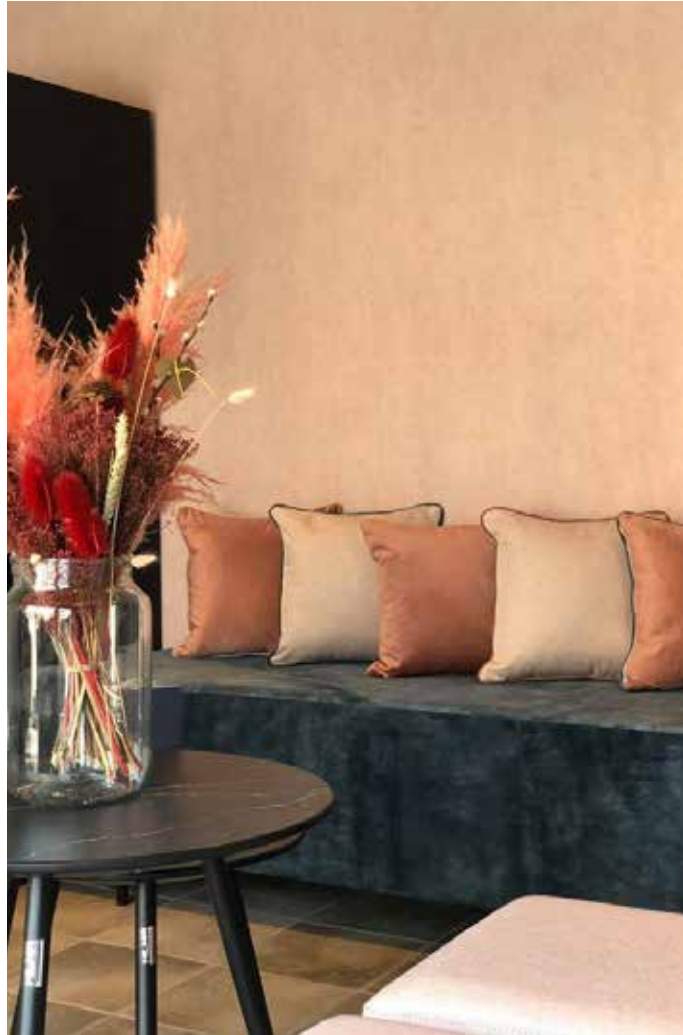
▲ Jeanne - Nieuwpoort