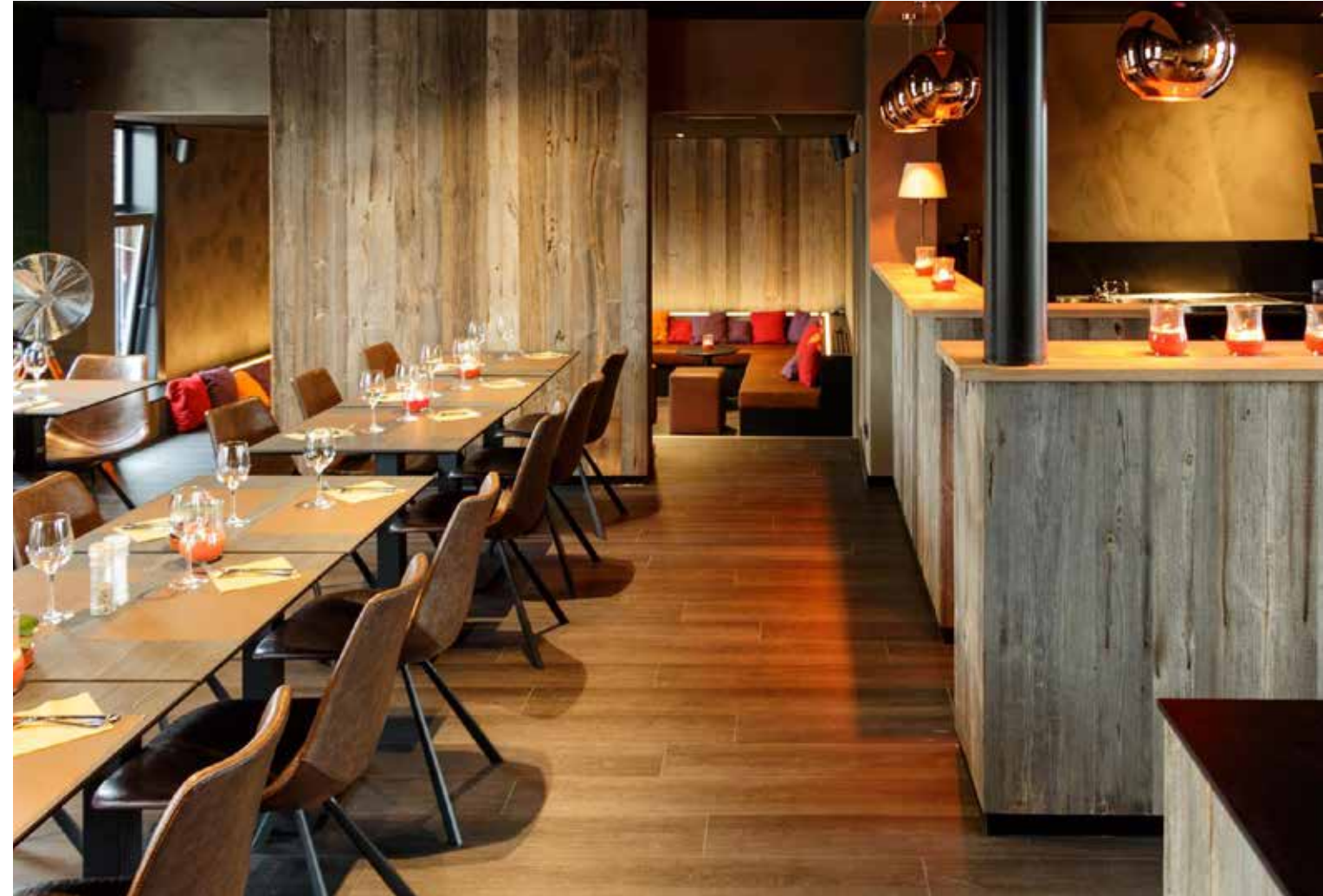
▲ D'eetage (Kastaar) - Wervik