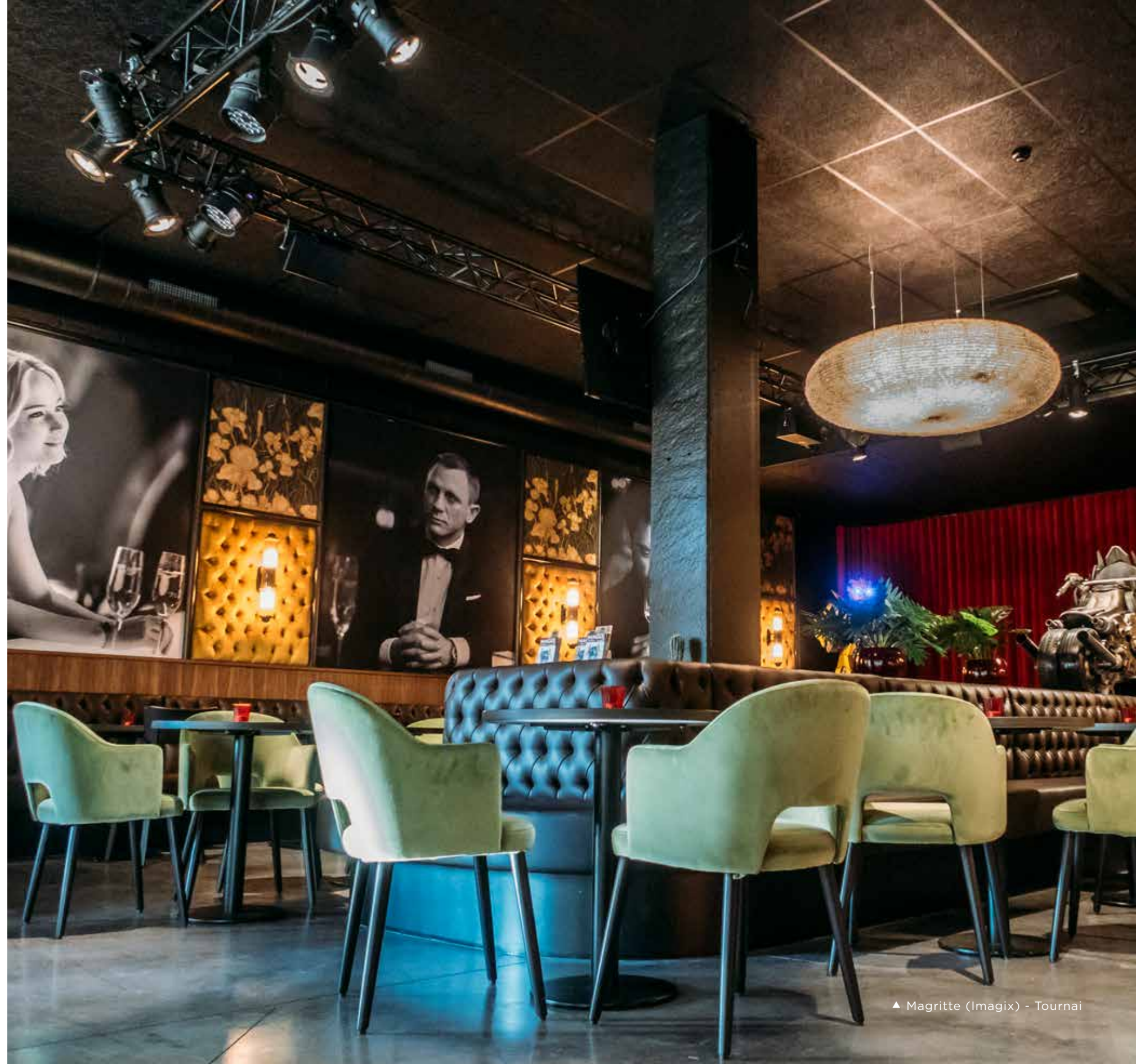
▲ Magritte (Imagix) - Tournai