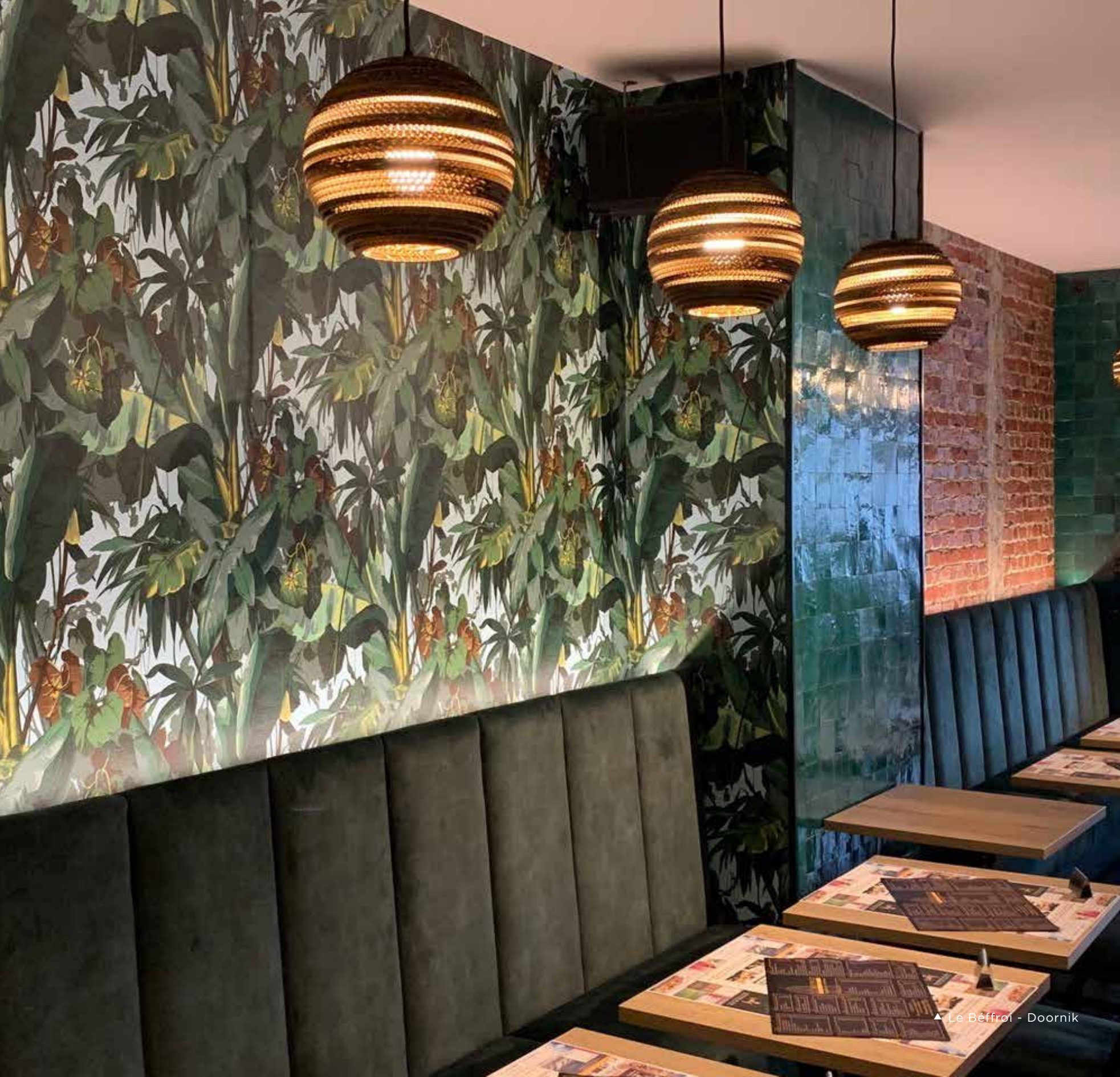
▲ Le Bèffroi - Doornik