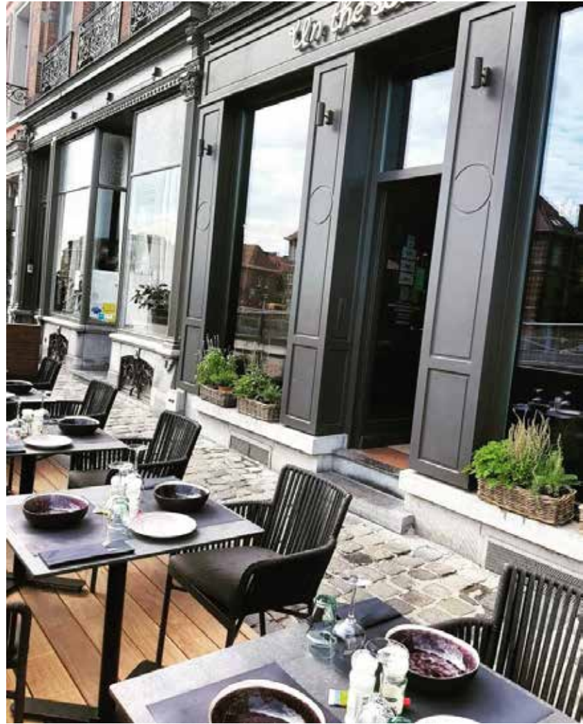
▲ Un thé sous le Figuier - Tournai